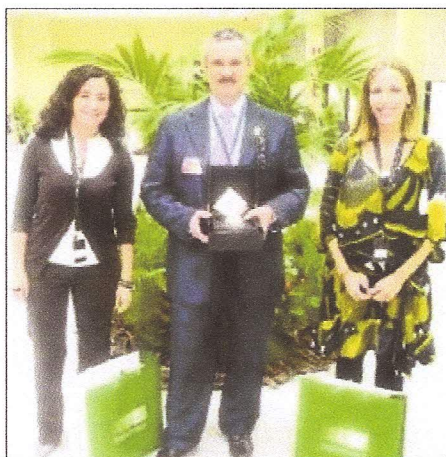
Responsables de la empresa Artauro, ayer en Joyacor.

HOY LLEGA LA COPA MUNDIAL Los empresarios presentes en Joyacor tienen puestas grandes expectativas en las dos últimas jornadas de la feria, porque al ser fin de semana se espera que se incremente el número de visitas y de contactos con clientes llegados de las provincias andaluzas y las regiones autónomas más cercanas.