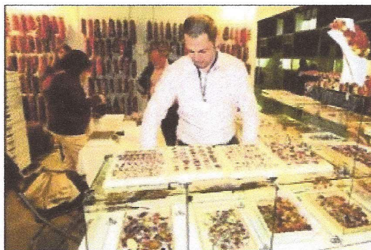
Un empresario coloca los artículos en una de las bateas de su expositor.

Esta noticia pertenece a la edición en papel. Ver archivo (pdf)