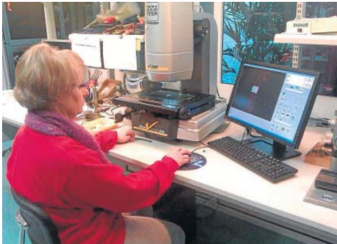
Moragas Technologie se encuentra en el polígono La Carlota.